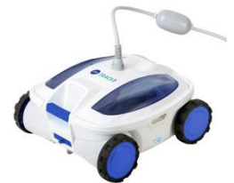
Roboter Robot RT1S