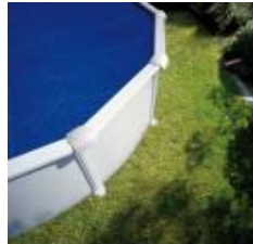
Isothermabdeckplane Isothermic cover CPROV600