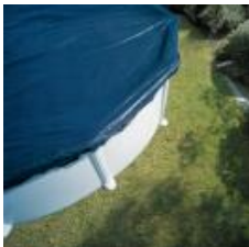
Winterabdeckung Winter cover CIPROV731